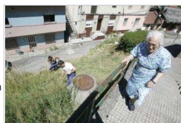
ACOGIDA. Una vecina sube por las escaleras mientras que dos presos retiran la maleza. / J. C. ROMÁN

• Los socialistas de Lena se autoexcluyen de todos los órganos de gobierno